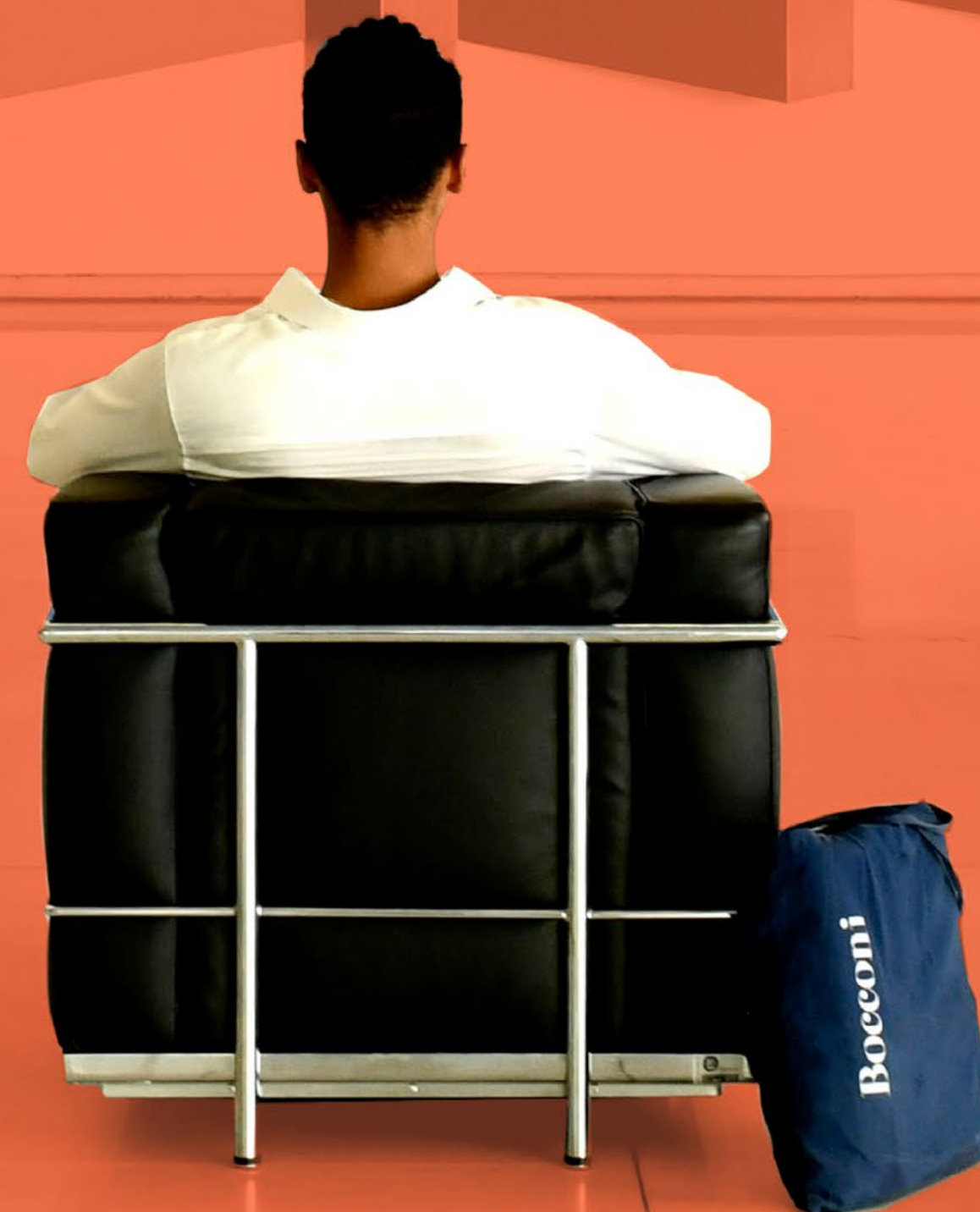
Nella foto: Uno studente Bocconi in visita alla BAG - Bocconi Art Gallery 2022

Guardare al futuro, per un'università, significa investire sulla produzione e diffusione della conoscenza, sulla ricerca e sulla formazione delle nuove generazioni. Per farlo è necessario unire visione e concretezza, promuovendo un'intensa attività accademica, culturale e sociale e mettendo a disposizione della propria comunità un ambiente vivace e stimolante. Con iniziative e progetti innovativi, sviluppati in partnership con l'Università, i Donor possono contribuire all'evoluzione dell'ambiente universitario e allo sviluppo degli spazi del Campus. Sono diversi i progetti volti alla promozione dell'inclusione e della diversità , oltre 10 le opere d'arte donate alla BAG – Bocconi Art Gallery e 44 gli spazi intitolati all'interno dell'Ateneo .